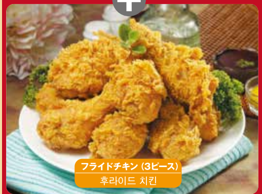
フライドチキン (3ピース) 후라이드 치킨