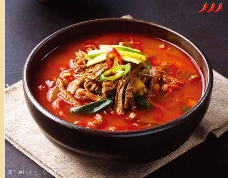
● 牛ユッケジャン 육계장 ¥950