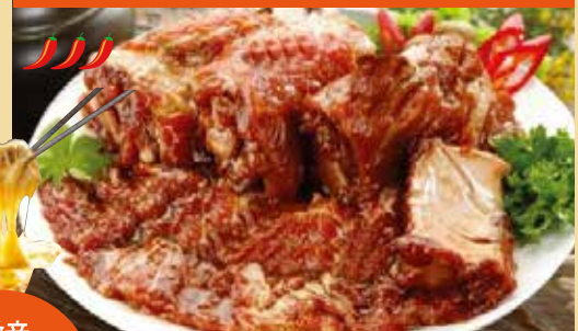
● 豚カルビ 돼지갈비 ¥1,050