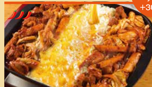
● タツカルビ 닭갈비 ¥1,050