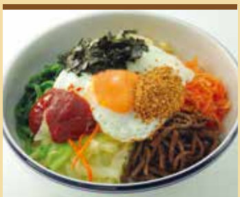
● ビビンバ丼 비빔밥 ¥950