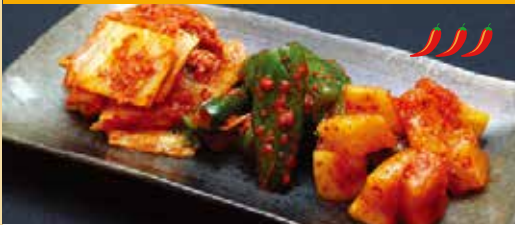
● キムチ盛り 모듬김치