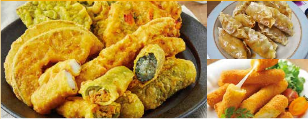
● おまかせ揚げ物盛合わせ (3種) 튀김셋트