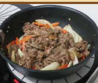
● 牛ブルゴギ丼 불고기 ¥1,050