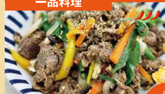
● 牛ブルゴギ 불고기 ¥1,050