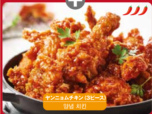
ヤンニョムチキン (3ピース) 양념 치킨