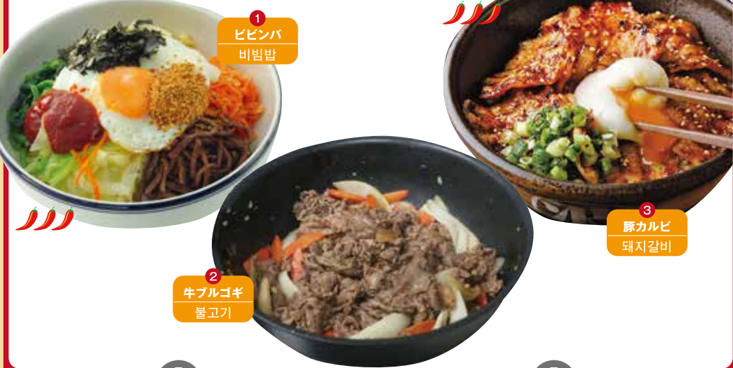
1 ビビンバ 비빔밥