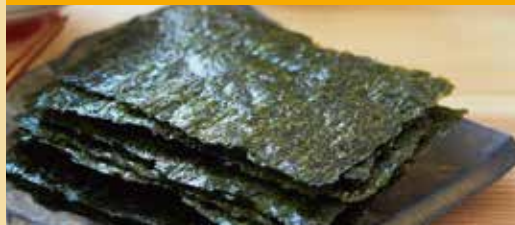
● やきのり 김