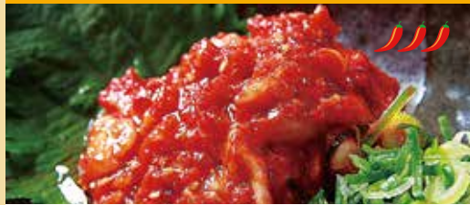
● チャンジャ 찜자