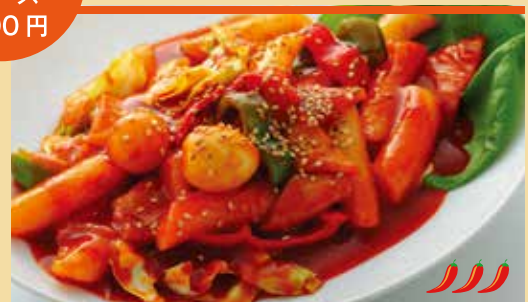
● トツポキ 떡볶기 ¥1,050