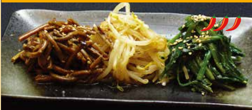
● ナムル盛り 모듬나물